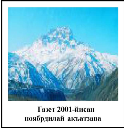
Газет 2001-йисан ноябрдилай акъатзава

РД-дин Докъузпара райондин общественно-политический газет. Общественно-политическая газета Докузпаринского района РД.