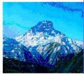
Газет 2001-йисан ноябрдйлай акъатъава