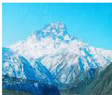
Газет 2001-йисан ноябрдилаы акъатзава

РД-дин Докъузпара райондин общественно-политический газет. Общественно-политическая газета Докузпаринского района РД.