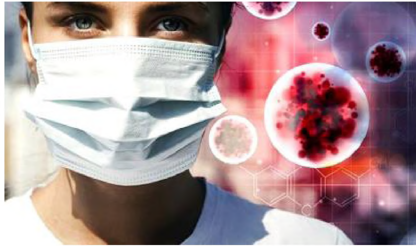
Алай вахтунда алимри COVID-19 сагъарунин рекъый мад адан хатасузвал ахтармишзава.

COVID-19 сагъаранунин рекъый авай тамам гъахъ-гъисабдикай ВОЗ-ди мукъвал вахтара хабар гуда. ВОЗ-ди гьеле алай йисан майдин эхирра коронавирусный инфекция сагъариз хъайи гидроксихлорохин-дал шак гъана, ам акъвазарнай. Ихътин жуьредин тест кIуд уьлкведа тухванвай.