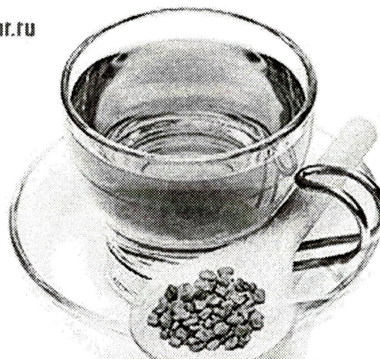
ХИЛЬБА - Пайгъамбардин Сунна

эфирдин гъери, крахмал, белокар, шекерар ква.