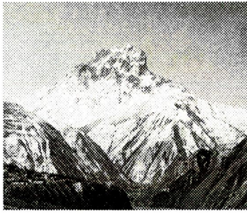
Газет 2001-йисан ноябрдилай акъатзава