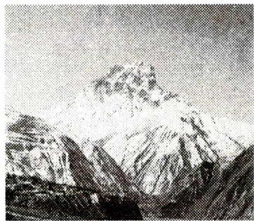
Газет 2001-йисан ноябрдилай акъатзава

РД - дин Докъузпара райондин общественно-политический газет. Общественно-политическая газета Докузпаринского района РД.